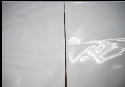
白着色フィルムでの比較 (左)イーグルソフト (右)C4-LLDPE

[フィルムの特徴] ○ フィルム表面に微細な凹凸があるため、艶消し効果によりフィルムに高級感を付与することができます。